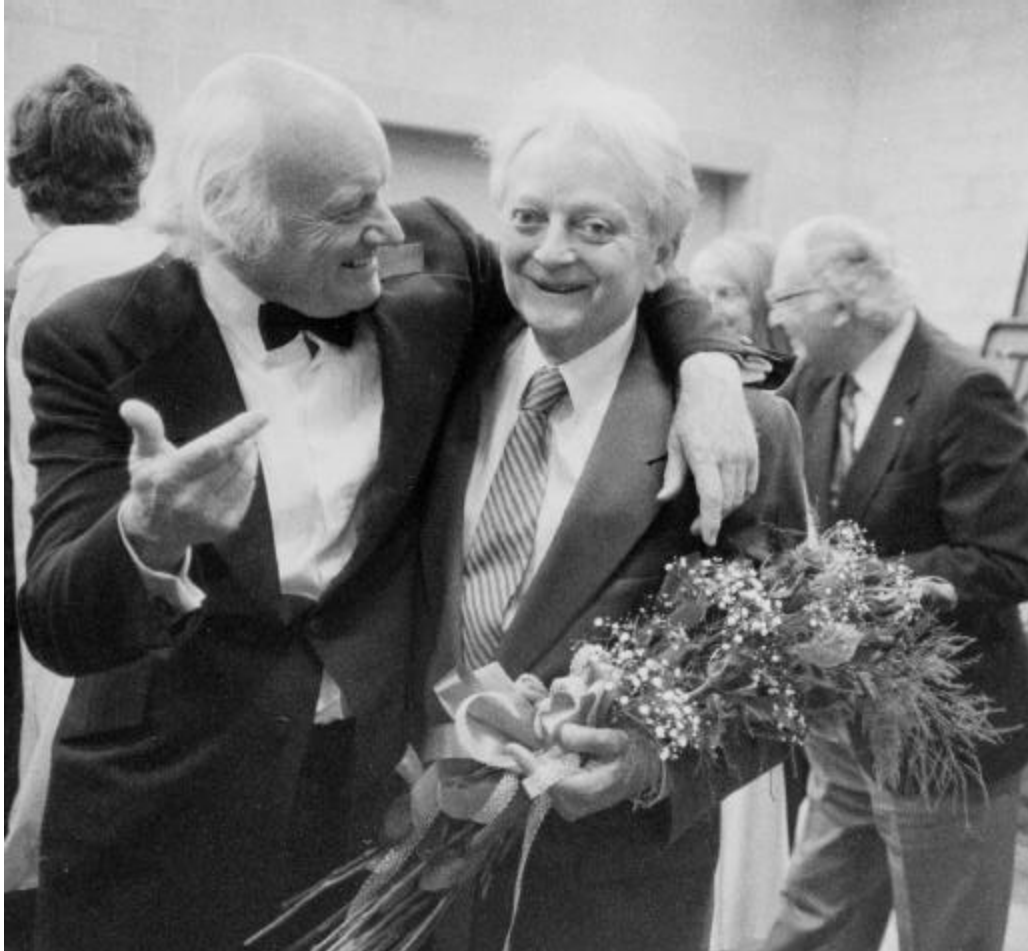
István Anhalt et Elmer Iseler à la suite de la première de Winthrop , 1986.