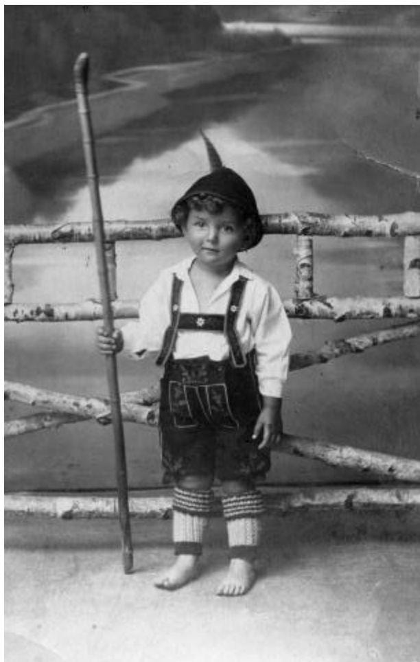
István Anhalt, Budapest, 1921.