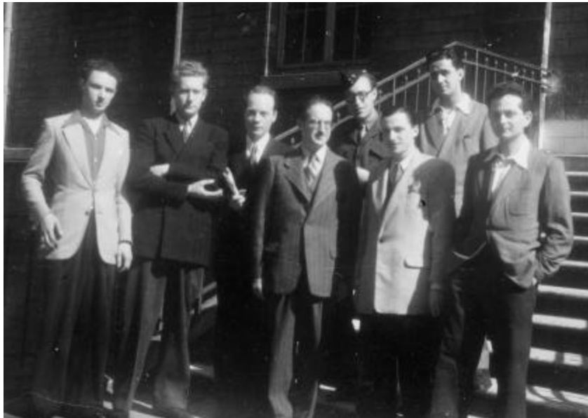
Classe de direction d'orchestre de Louis Fourestier au Conservatoire national de musique et d'art dramatique de Paris, [ca 1947].