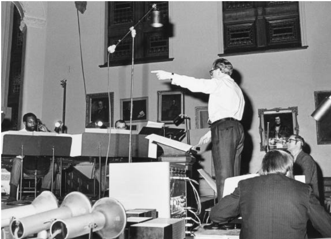
István Anhalt lors d'une répétition de son œuvre Foci à la Salle Redpath, 1971.