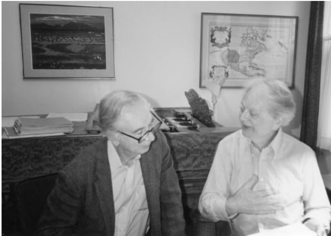
István Anhalt et George Rochberg, 1985.