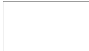
(Passport Photograph in colour, 50 mm x 70 mm)