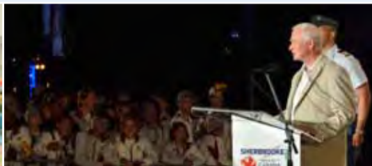
En août, le gouverneur général a annoncé la clôture officielle des Jeux d'été du Canada 2013 à Sherbrooke (Québec).