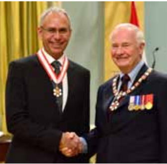
Arnold Boldt, O.C., compte parmi les 38 personnes qui ont reçu l'Ordre du Canada le 22 novembre 2013.

Le gouverneur général décerne des distinctions honorifiques et des prix à des gens qui ont fait preuve d'excellence ou d'une volonté de servir le pays. L'excellence et les réalisations sont soulignées par l'entremise du Régime canadien de distinctions honorifiques et par la concession d'emblèmes héraldiques (armoiries, drapeaux et insignes).