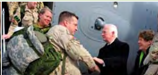
Lorsque les derniers membres des FAC à servir en Afghanistan sont rentrés au pays, Leurs Excellences étaient là pour les accueillir.