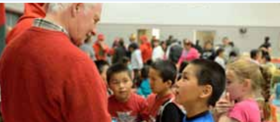
En juin, Son Excellence a participé à un rassemblement communautaire à la Amos Comenius Memorial School à Hopedale (Terre-Neuve-et-Labrador)

Le gouverneur général participe à des cérémonies commémoratives, des célébrations nationales, des visites dans les provinces et les territoires et des activités communautaires partout au pays. Il est également l'hôte d'événements dans ses deux résidences officielles : Rideau Hall à Ottawa et la Citadelle de Québec.