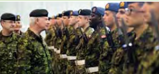
En tant que commandant en chef, Son Excellence a inspecté la garde d'honneur et reçu le salut royal au début de sa visite à la BFC Borden.

Le gouverneur général rend visite aux membres des Forces armées canadiennes, à leurs familles et à leurs proches, au pays et à l'étranger, décerne des distinctions militaires et présente de nouveaux drapeaux aux CAF. Il signe tous les certificats de commission des officiers qui servent dans les Forces, ainsi que ceux des nouveaux généraux et officiers généraux. De plus, sur la recommandation du premier ministre, il nomme le chef d'état-major de la Défense.