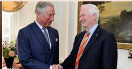
En avril, pendant qu'il se trouvait à Amsterdam pour assister à la cérémonie d'investiture de Sa Majesté le roi Willem-Alexander, Son Excellence a rencontré Son Altesse Royale le prince de Galles.

En 2013-2014, le Bureau a appuyé près de 100 activités de représentation de la Couronne au Canada.