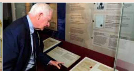
Le gouverneur général a eu l'occasion d'examiner la Proclamation royale de 1763, qui était exposée au Musée canadien des civilisations en octobre.