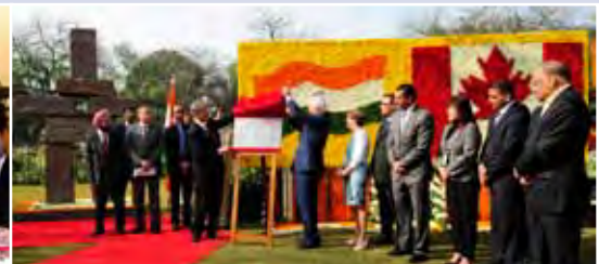
En février, Leurs Excellences ont dévoilé et présenté un inuksuk au peuple de l'Inde au nom du peuple du Canada; ce cadeau symbolise l'amitié et la coopération entre les deux pays.

En 2013-2014, le Bureau a appuyé le gouverneur général David Johnston dans le cadre des visites qu'il a effectuées dans huit pays pour représenter le Canada à l'étranger.