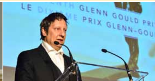
En mars, Robert Lepage, C.C., O.Q., a reçu le dixième prix Glenn Gould à Rideau Hall, en reconnaissance de son excellence sur le plan artistique et de son dévouement de longue date à l'égard des arts.