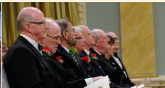
En avril, cinq lauréats ont reçu le Prix Killam 2013, administré par le Conseil des arts du Canada. Ces prix sont attribués chaque année à des chercheurs canadiens en reconnaissance de réalisations professionnelles remarquables.