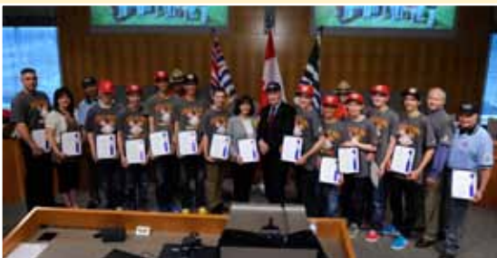
Au cours d'une visite à Vancouver, en juin, Son Excellence a remis le Prix pour l'entraide à l'équipe de baseball de la Petite Ligue de Langley, en reconnaissance des services communautaires rendus à l'occasion de la Pearl of Africa Series de 2012.