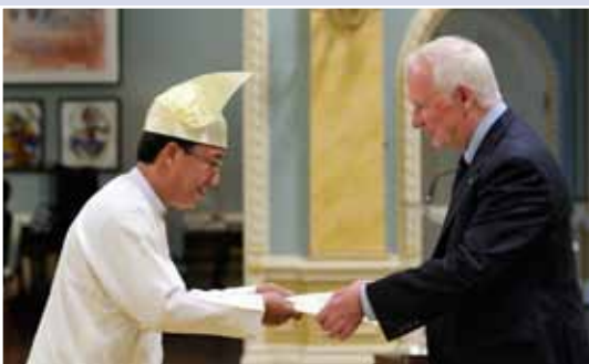
Le 10 juin, Son Excellence M. Hau Do Suan, ambassadeur de la République de l'Union du Myanmar, a présenté ses lettres de créance.