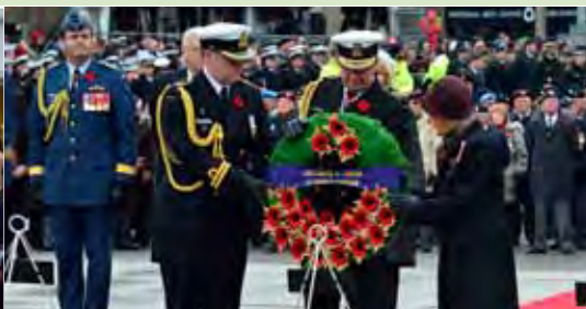
Durant la cérémonie du jour du Souvenir, Leurs Excellences ont déposé la première couronne devant le Monument commémoratif de guerre du Canada, au nom du peuple canadien.