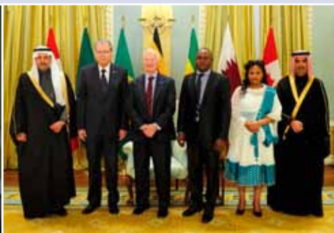
Le 28 janvier, le gouverneur général a reçu les lettres de créance de quatre ambassadeurs (Arabie saoudite, Brésil, Éthiopie et Qatar) et d'un haut-commissaire (Ouganda).