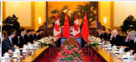
En octobre, le gouverneur général a rencontré Son Excellence M. Xi Jinping, président de la République populaire de Chine, avec qui il a discuté d'intérêts communs aux deux pays.