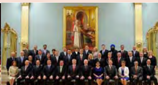
Son Excellence a présidé l'assermentation du nouveau conseil des ministres le 15 juillet 2013.