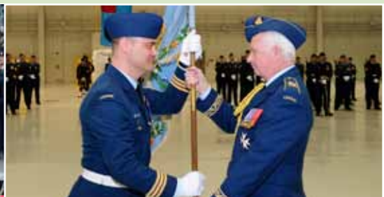
Lors d'une visite à la Garnison Petawawa en mars, le gouverneur général a participé à une cérémonie visant à remettre un drapeau au 450 e Escadron tactique d'hélicoptères.