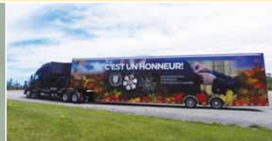
La nouvelle exposition itinérante intitulée C'est un honneur! a entamé son voyage dans le Canada le 31 juillet. Rendue possible grâce à la générosité de la Fondation de la famille Taylor, l'exposition présente des panneaux d'interprétation, des éléments multimédias et des objets historiques, offrant la possibilité aux visiteurs de tout âge d'en apprendre davantage au sujet du Régime canadien de distinctions honorifiques et de quelques-uns de ses récipiendaires.