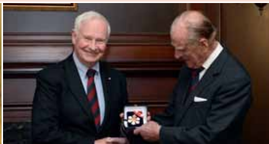
Pendant une visite à Toronto en avril, Son Excellence a remis l'insigne de Compagnon de l'Ordre du Canada à Son Altesse Royale le prince Philip, duc d'Édimbourg.