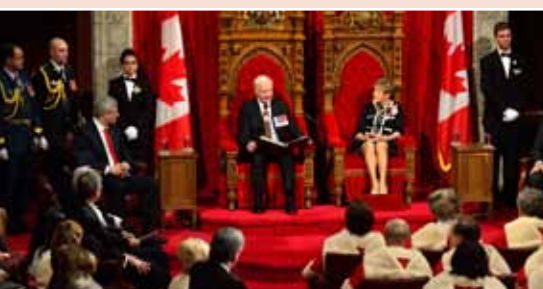
Le gouverneur général a lu le discours du Trône au Sénat le 16 octobre 2013.