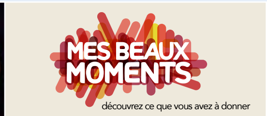
En novembre, Son Excellence a lancé la campagne Mes beaux moments.