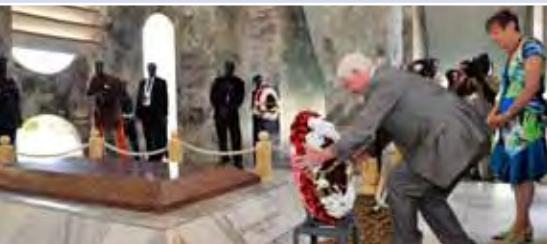
En mai, Leurs Excellences ont rendu hommage à feu M. Kwame Nkrumah, ancien président du Ghana, en déposant une couronne de fleurs sur son mausolée.

Le gouverneur général représente le Canada au pays et à l'étranger, accueille les chefs d'État en visite au Canada, effectue des visites d'État à l'étranger, reçoit les lettres de créance des chefs de missions étrangères et signe des documents diplomatiques.