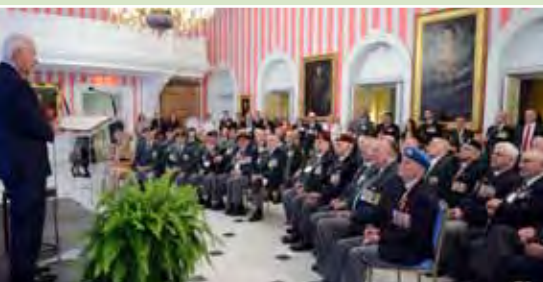
En juin, Son Excellence a eu l'occasion de rendre hommage à ceux qui ont servi pendant la guerre de Corée.