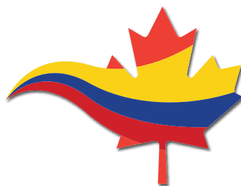
República de Colombia

29 de noviembre al 3 de diciembre de 2014