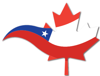
República de Chile

29 de noviembre al 3 de diciembre de 2014