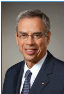
L'honorable Joe Oliver Ministre des Ressources naturelles

M. Baird est membre de la Légion royale canadienne, du club Kiwanis de Nepean et de l'Association de la vie communautaire qui compte le plus de membres au Canada. M. Baird est titulaire d'un baccalauréat en science politique de l'Université Queen's.