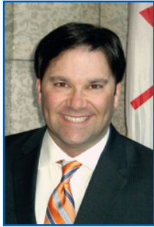
Don Davies Député

Don Davies est le porte-parole de l'opposition officielle en matière de commerce international; le porte-parole adjoint en matière de citoyenneté, d'immigration et de multiculturalisme; et le vice-président du Comité permanent du commerce international de la Chambre des communes.