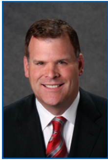
L'honorable John Baird Ministre des Affaires étrangères