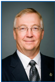
Earl Dreeshen Député

M. Davies a auparavant occupé les postes de porte-parole en matière de sécurité publique et de sécurité nationale, et de la Diversification de l'économie de l'Ouest. L'un des députés les plus actifs du Parlement du Canada, il s'est constamment classé parmi les dix premiers lors des débats et des projets de loi d'initiative parlementaire. Avant d'être élu au Parlement, M. Davies assumait les fonctions de directeur des services juridiques chez un important syndicat (1992-2008), de conseiller en matière de politiques auprès du chef du NPD en Alberta (1989-1991) et d'avocat en exercice.