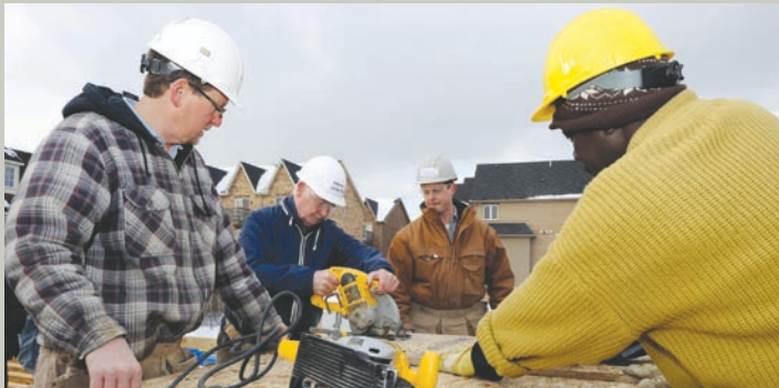
Projet d'Habitat pour l'humanité, à Toronto (Ontario), le 14 janvier 2011. Le gouverneur général prête main-forte à des bénévoles dans le quartier Westin Road.

« J'ai bon espoir que notre pays continuera à développer une culture d'entraide. En donnant généreusement, non seulement aidons-nous autrui, mais nous inspirons aux autres le désir de donner, créant ainsi un esprit de bonne volonté qui peut se répandre à travers le pays. Les Canadiens ont toujours fait preuve de générosité; je suis fier de voir des voisins s'entraider. Grâce au bénévolat et à la philanthropie, nous avons la possibilité de changer le monde, un homme, une femme et un enfant à la fois. »