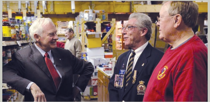
Siège social du Fonds du Coquelicot à Calgary (Alberta), le 30 novembre 2010. Le gouverneur général a aidé à remplir des paniers de nourriture et s'est entretenu avec des anciens combattants au sujet des problèmes personnels auxquels ils ont été confrontés à la fin de leur service militaire.