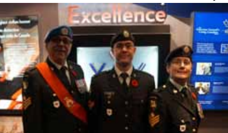
Des visiteurs à l'occasion des célébrations du jour du Souvenir à Sylvan Lake (Alberta)