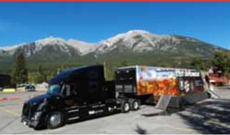
L'exposition entourée par les Rocheuses à Canmore (Alberta)