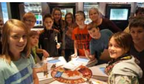
Des étudiants de l'école Mother Teresa à Sylvan Lake (Alberta)

En tournée depuis la fin de la fin de juillet 2013, l'exposition itinérante C'est un honneur! rassemble, inspire et honore les Canadiens d'un bout à l'autre de notre pays.