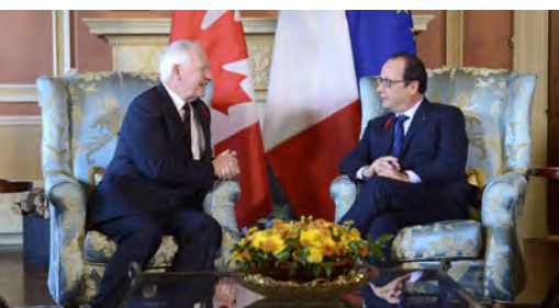
Le gouverneur général s'est entretenu avec Son Excellence monsieur François Hollande, président de la République française, à Rideau Hall le 3 novembre 2014, au cours de la visite d'État du président au Canada.

Son Excellence le très honorable David Johnston, C.C., C.M.M., C.O.M., C.D. Gouverneur général du Canada