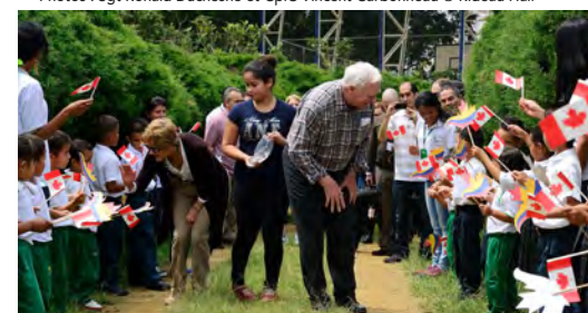
Leurs Excellences ont été accueillies par des enfants qui agitaient des drapeaux du Canada et de la Colombie au cours de leur visite en Colombie le 7 décembre 2014.