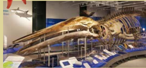
● 世界中でも数少ないシロナガスクジラの骨格の完全な標本！