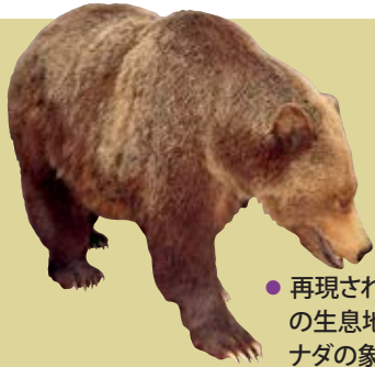
● 再現された自然の生息地でのカナダの象徴的な哺乳動物

カナダ最大の魅力とも言える美しい大自然。カナダの多様な自然を紹介したカナダ歴史博物館を訪れずして、オタワ旅行を語ることはできません。カナダの国立自然史博物館である当館には世界トップクラスのギャラリーが揃っており、魅力たっぷりの自然を観察・体験できます。