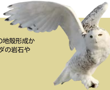
● カナダの鳥類では最大のコレクションの展示