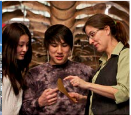
展示訪問者の写真: Martin Lipman 著作権所有 カナダ自然博物館