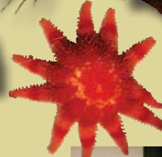
● 生きた昆虫、爬虫類、両生類、及び海生無脊椎動物