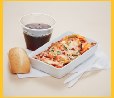
Table d'hôte à 15 $ lorsque disponible

Chaque plateau-repas inclut une boisson non alcoolisée