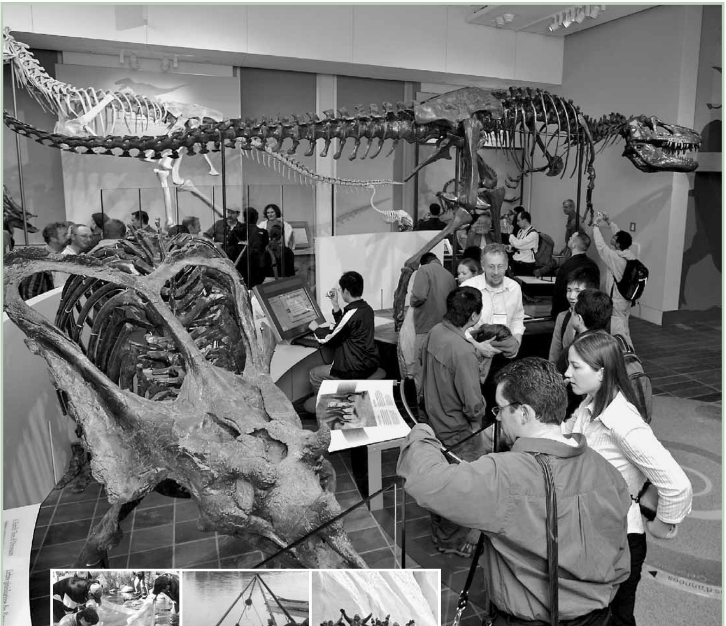
Photos : (haut) Martin Lipman, (gauche) École secondaire Frenette, (centre) Archives nationales du Canada, (droite) Étudiants sur la banquise.