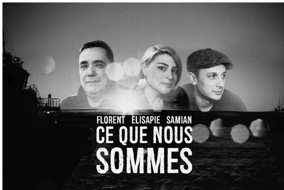
Ce que nous sommes, ICI Musique