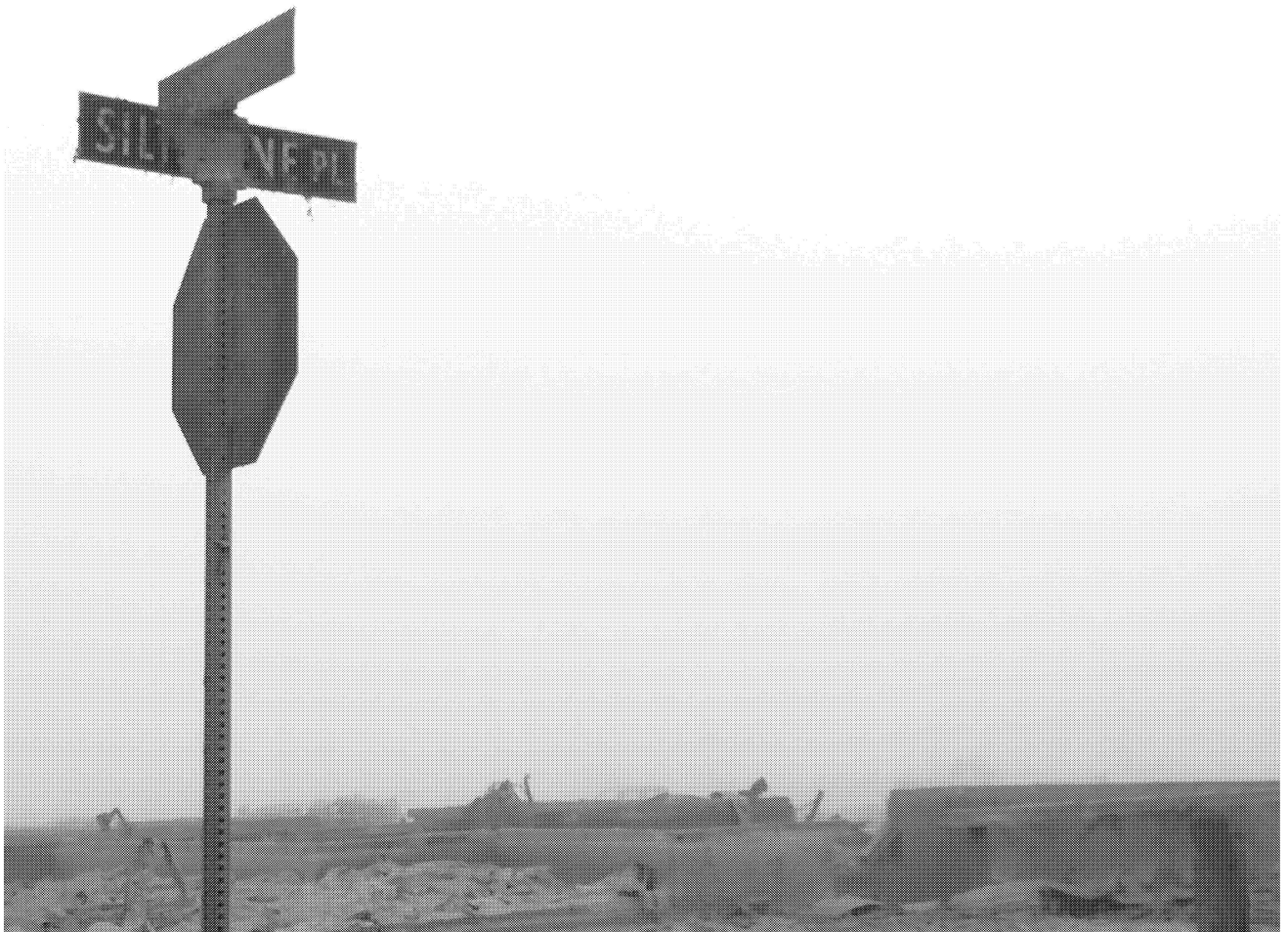
L'intersection de Prospect Drive et Siltstone Place à Timberlea, Fort McMurray, Alberta.

L'audience devant la Cour d'appel fédérale sur la fusion des deux unités de négociation de Radio-Canada doit avoir lieu le 13 septembre 2016. D'ici là, les négociations se poursuivent avec les deux unités de négociation.