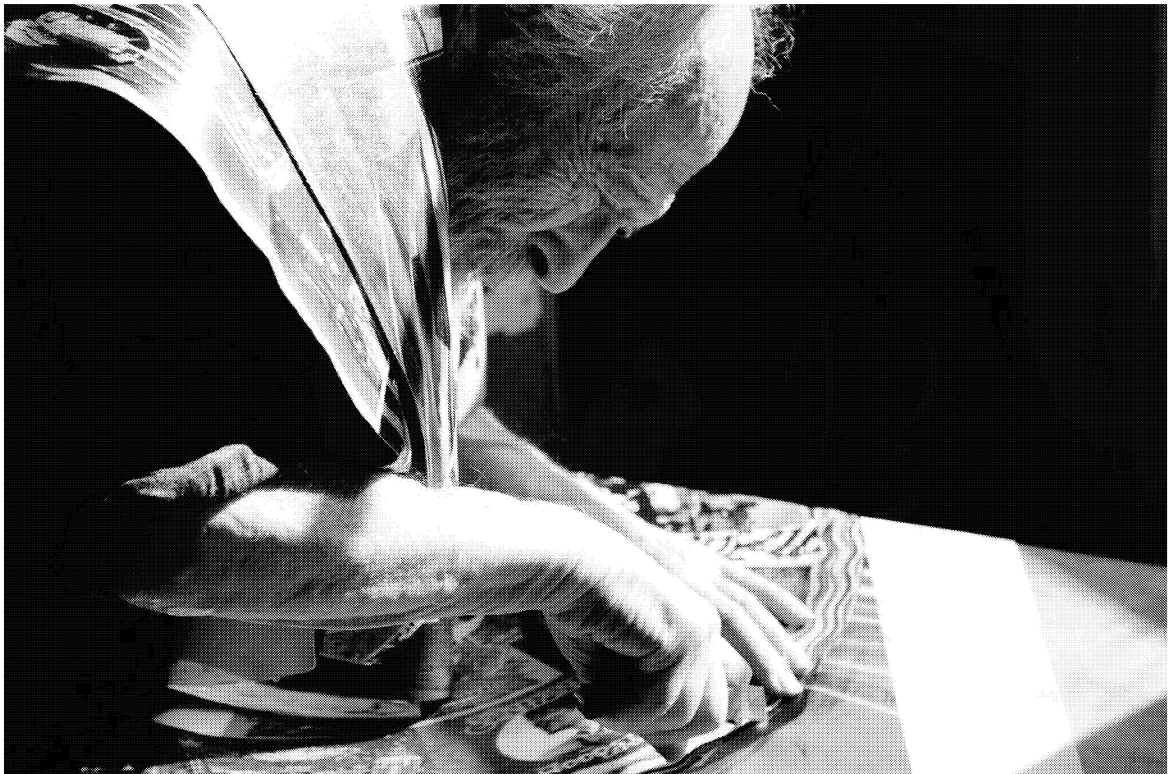
Billsville, présenté sur CBC Short Docs

Revenus – Bien qu'il soit encore tôt pour se prononcer, les résultats à ce jour permettent de penser que la cible annuelle sera atteinte.