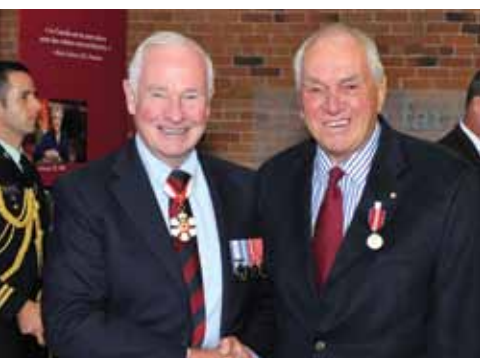
Son Excellence remet la Médaille du jubilé de diamant à l'honorable Ed Broadbent, le 10 septembre 2012.