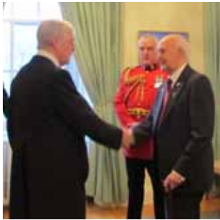
Photo : la résidence du lieutenant-gouverneur, lieutenant-gouverneur de Terre-Neuve-et-Labrador