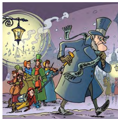
Un conte de Noël