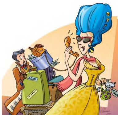
Annabelle suit sa voix

La populaire série des Concerts bouts d'chou, à sa neuvième saison, offrait quatre programmes pour les 3 à 8 ans présentés chacun quatre fois, en français et en anglais, à la salle Panorama du CNA : Annabelle suit sa voix (novembre), La tête dans les nuages (janvier), L'expédition de la Rythmobile (avril) et Mission sur la planète Alliage (juin). Deux présentations hors série du Concert bouts d'chou Un conte de Noël ont aussi pris l'affiche dans la période des Fêtes. La série a fait salle comble, attirant 4 629 spectateurs au total. Les Jeunesses musicales du Canada se sont associées au CNA une fois de plus pour présenter cette série. Des activités touche-à-tout d'avant-concert étaient aussi offertes aux familles par des partenaires locaux du CNA, dont l'organisme Music for Young Children et les Ottawa Suzuki Strings.