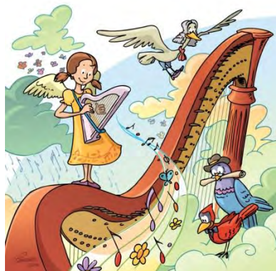
La tête dans les nuages