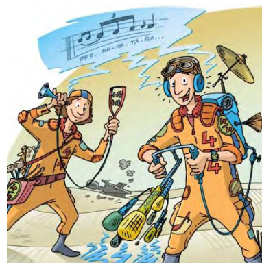
L'expédition de la Rythmobile