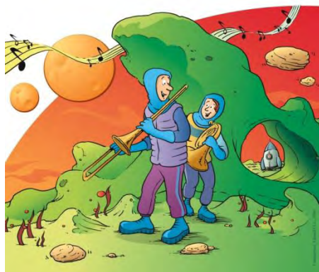
Mission sur la planète Alliage