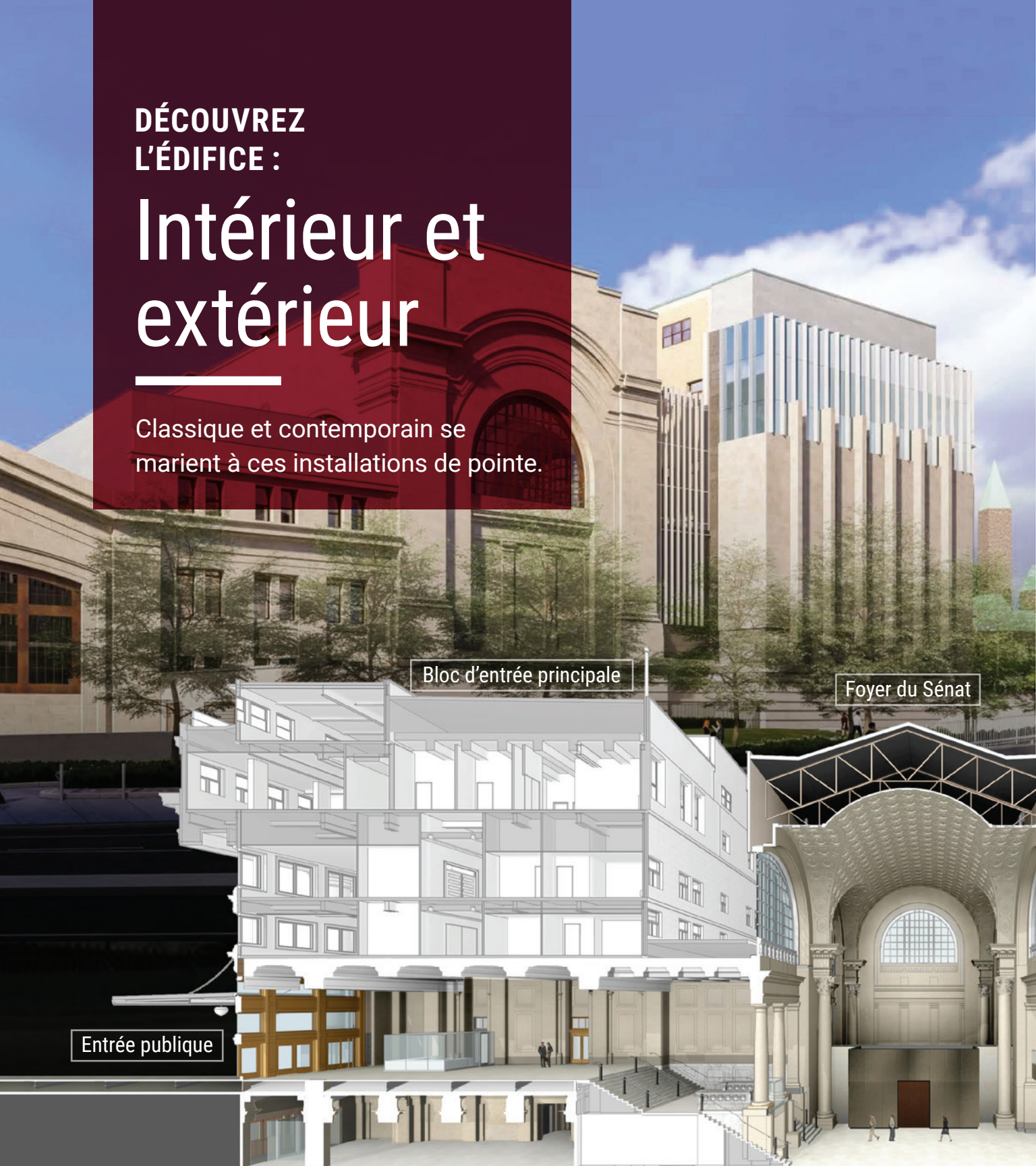
Bloc d'entrée principale

Classique et contemporain se marient à ces installations de pointe.