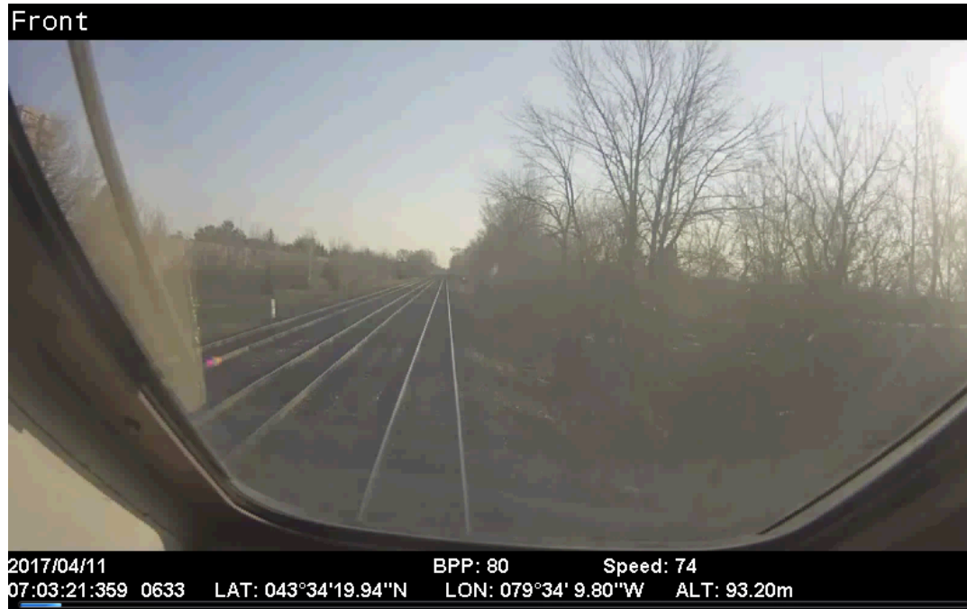
Caméra orientée vers l'avant