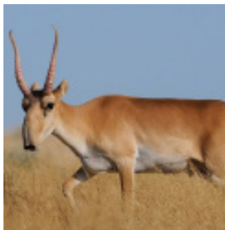
2 - Saïga