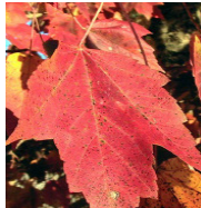
2 - érable