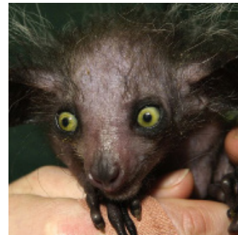
3 - Mouchoir Royal

Q4. Quel animal a récemment donné naissance au zoo de Magnetic Hill, à Moncton?