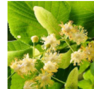
3 - tilleul

Q6. Où se trouve l'un des centres de recyclage les plus avancés? (INDICE: La collaboratrice Victoria est là!)