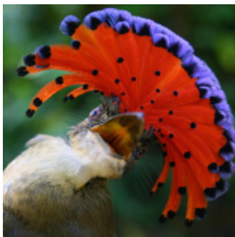
Réponse: 1 - Aye Aye

Q3. DÉFI! Quel est le nom de chacun de ces animaux étranges?