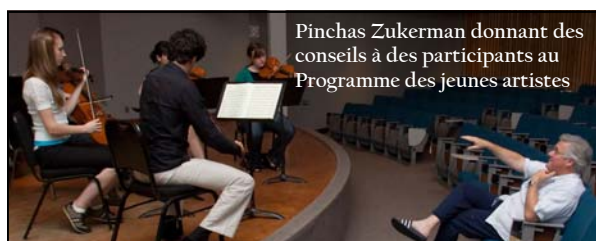
Pinchas Zukerman donnant des conseils à des participants au Programme des jeunes artistes