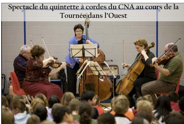
Spectacle du quintette à cordes du CNA au cours de la Tournée dans l'Ouest

Les cinq jeunes apprentis joueurs de cordes de l'Institut de musique orchestrale (IMO) ont pour la première fois voyagé avec l'Orchestre et joué dans les sections appropriées à deux étapes de la tournée pour faire l'expérience concrète de ce genre de périple professionnel. À Calgary, ils ont rencontré, avec Pinchas Zukerman, les participants au programme équivalent de l'Orchestre philharmonique de Calgary afin d'échanger sur leurs expériences respectives.