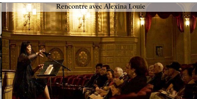
Rencontre avec Alexina Louie