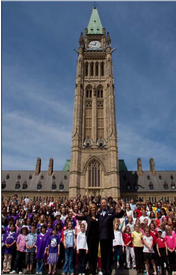
Le Lundi en Musique du CNA sur la Colline du Parlement

Plus de 700 000 élèves dans au-delà de 2 000 écoles (y compris plus de 70 de la RCN) de tous les territoires et provinces ont pris part au Lundi en Musique.