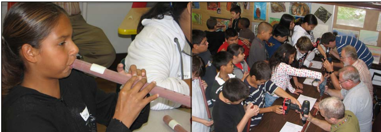
Des élèves fabriquent leur flûte amérindienne dans le cadre du programme Connexions musicales