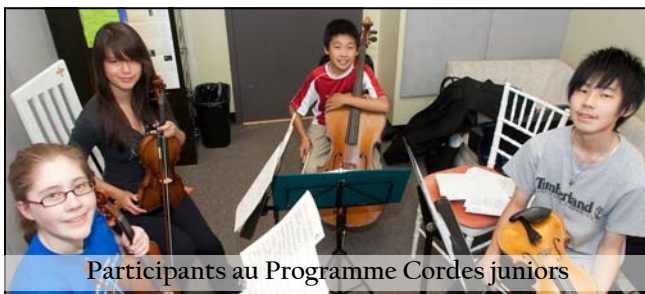
Participants au Programme Cordes juniors

*Élève ayant déjà participé au Programme des jeunes artistes