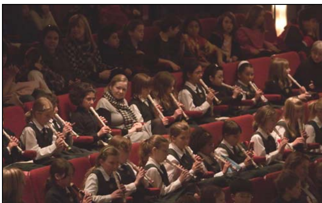
Des élèves jouent avec l'Orchestre du CNA à un concert des matinées scolaires

Par les années passées, le CNA pouvait offrir aux écoles un tarif subventionné pour le programme Musiciens dans les écoles grâce à la contribution du Music Performance Fund (MPF) de la Fédération américaine des musiciens, qui représentait 35 p. 100 des coûts. Malheureusement, des changements majeurs dans l'industrie de l'enregistrement sonore ont entraîné une réduction de la part fournie par l'organisme en 2002 et la cessation complète du financement en 2008-2009. Les Amis du CNA ont généreusement augmenté leur apport en 2008-2009, pour assumer 45 p. 100 du coût total des 30 spectacles, donnant ainsi à plus de 9 000 élèves l'occasion de participer au programme.