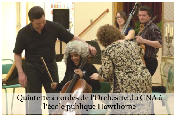
Quintette à cordes de l'Orchestre du CNA à l'école publique Hawthorne

Buzz en direct MC a été inauguré à Ottawa en septembre 2000. Depuis, près de 38 000 élèves et étudiants s'y sont inscrits et plus de 72 500 billets ont été vendus. Le site Web www.buzzendirect.ca permet d'obtenir des renseignements sur les spectacles à venir et d'acheter des billets en ligne. De l'information est également transmise aux membres par l'intermédiaire d'outils de médias sociaux comme la page de Facebook, qui compte plus de 875 membres, et une mise à jour d'un message texte hebdomadaire facultatif.