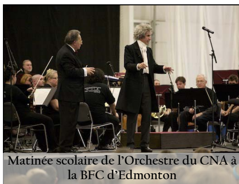
Matinée scolaire de l'Orchestre du CNA à la BFC d'Edmonton