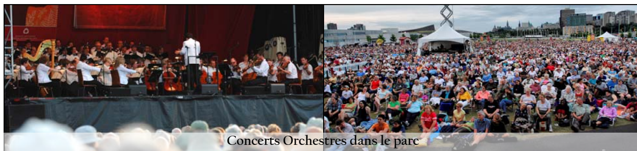
Concerts Orchestres dans le parc

Le Centre national des Arts a parrainé un trio d'instrumentistes du Programme de formation des jeunes artistes qui, le 28 mai dernier, a assuré la musique tout au long de la cérémonie de remise des prix Bâtitseur communautaire de Centraide . Le programme des Prix Bâtitseur communautaire permet à Centraide de rendre hommage à des bénévoles exceptionnels d'Ottawa – des organismes, des partenariats, des agences, des groupes de quartier et des particuliers qui travaillent sans relâche, avec passion et en collaboration, pour faire de la ville un meilleur endroit où vivre, travailler et élever une famille.