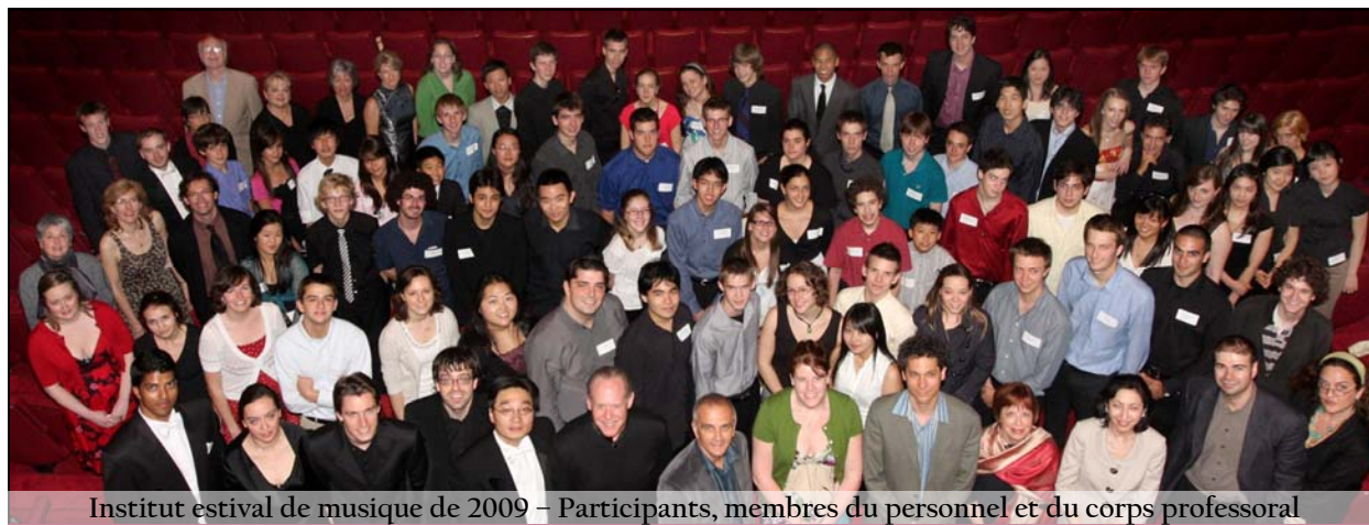
Institut estival de musique de 2009 – Participants, membres du personnel et du corps professoral