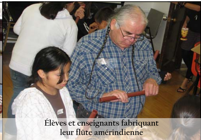
Élèves et enseignants fabriquant leur flûte amérindienne