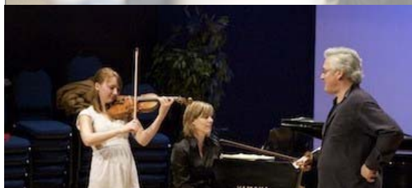
Atelier de maître de Pinchas Zukerman à Calgary