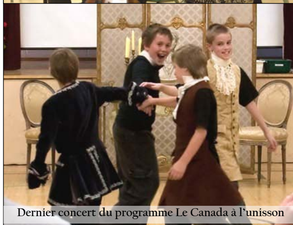
Dernier concert du programme Le Canada à l'unisson