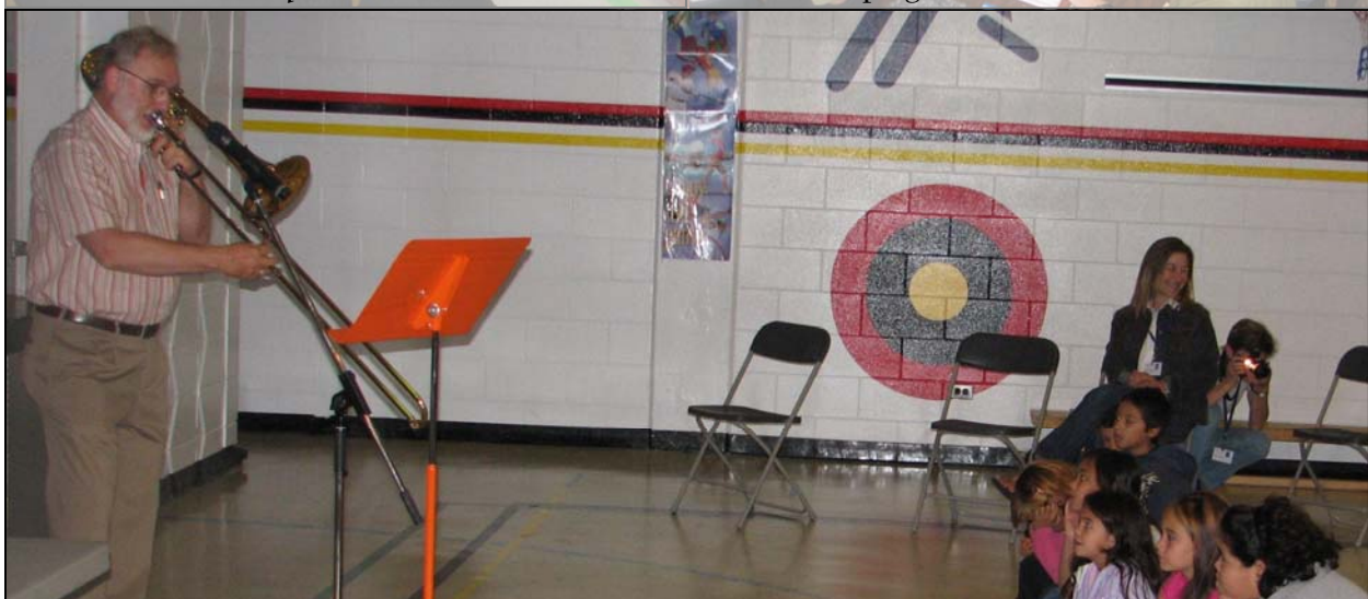
Prestation de Douglas Burden, trombone basse de l'Orchestre du CNA, dans le cadre de Connexions musicales