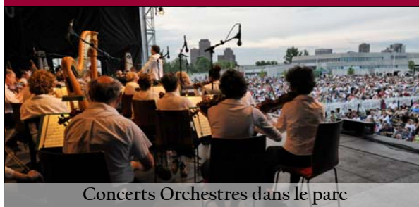
Concerts Orchestres dans le parc

- Extrait d'un courriel spontané reçu par le Centre national des Arts en juillet 2009