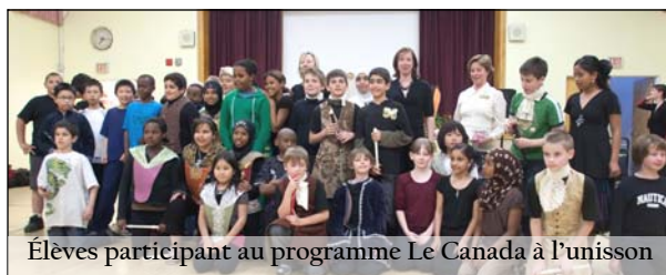
Élèves participant au programme Le Canada à l'unisson