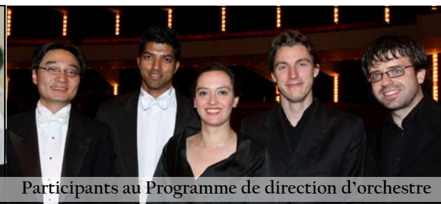
Participants au Programme de direction d'orchestre