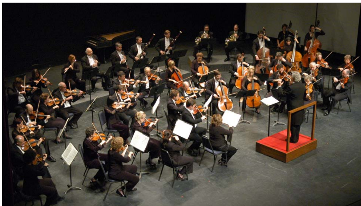
Pinchas Zukerman dirige l'Orchestre du Centre national des Arts