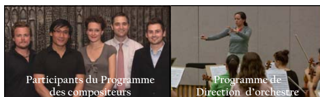
Participants du Programme des compositeurs