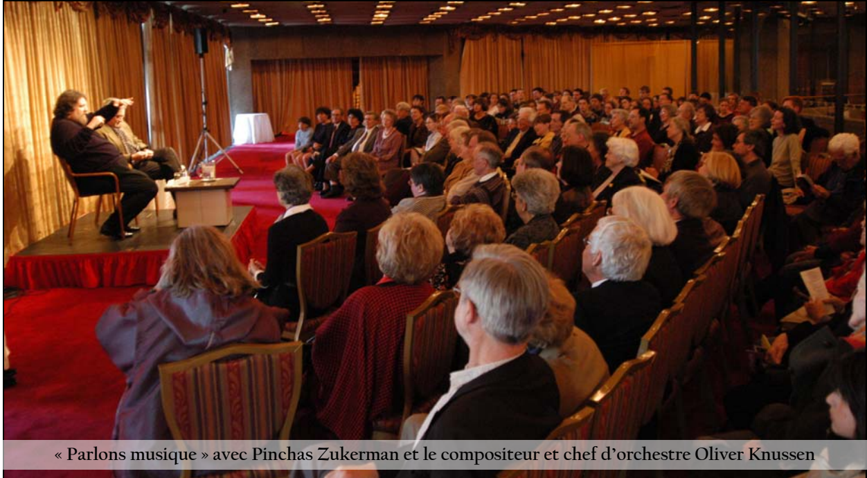
« Parlons musique » avec Pinchas Zukerman et le compositeur et chef d'orchestre Oliver Knussen