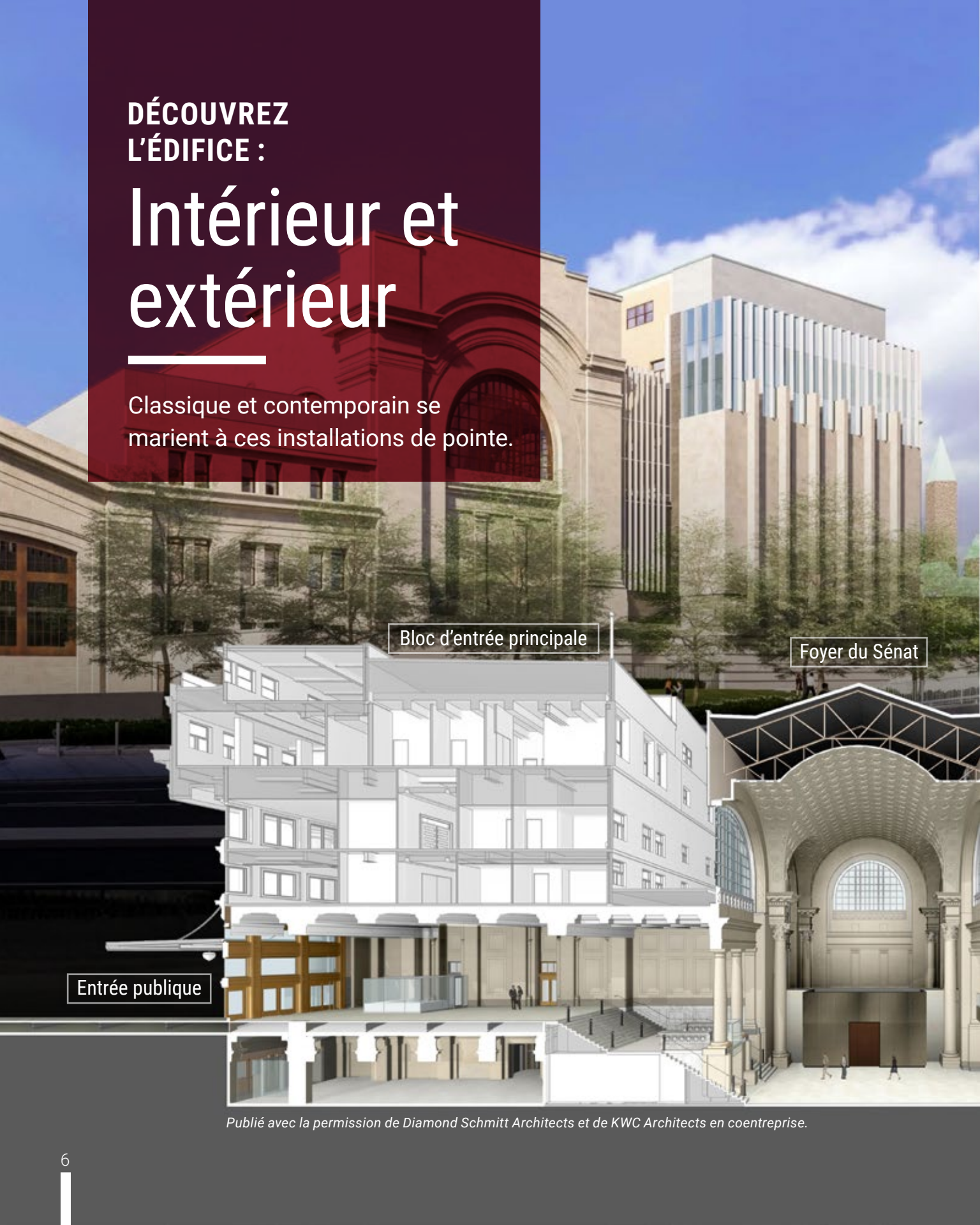
Bloc d'entrée principale

Classique et contemporain se marient à ces installations de pointe.